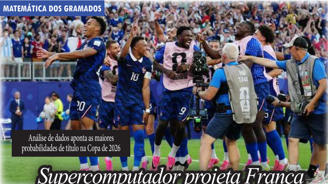
Análise de dados aponta as maiores probabilidades de título na Copa de 2026