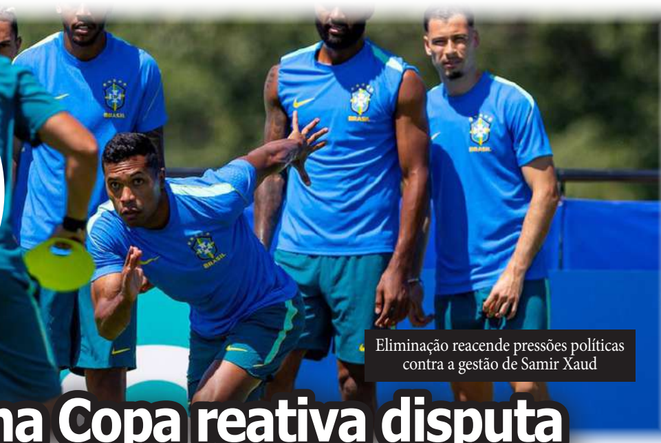
Eliminação reacende pressões políticas contra a gestão de Samir Xaud