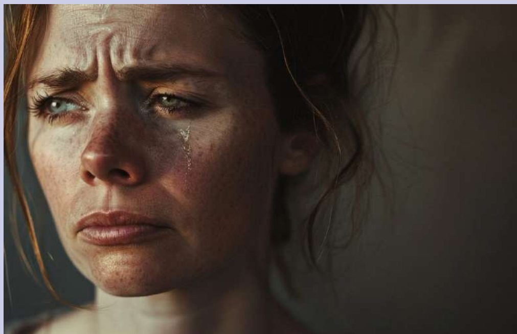
imagem permanente de vítima para atrair atenção, despertar compaixão e até obter benefícios pessoais, em vez de concentrar as energias na recuperação”, afirmou Rogério Fonteles.

Decisão prevê remoção de publicações, proíbe republicação de conteúdo semelhante e fixa multa de até R$ 50 mil em caso de descumprimento