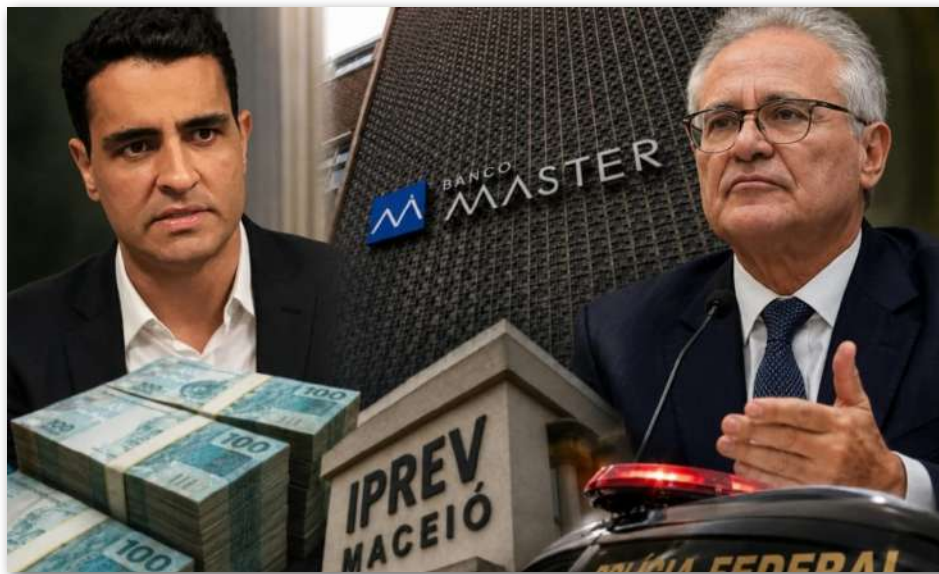
Renan Calheiros quer explicações de governo JHC