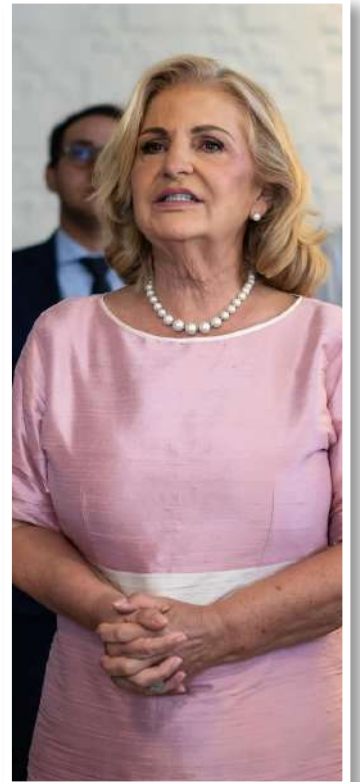
Fátima Rezende - Prefeita do Pilar