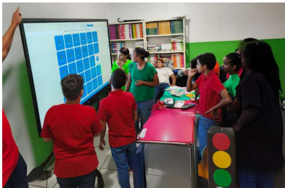
Detran na Escola

“Quando os professores transformam o conteúdo trabalhado nas formações em soluções criativas e inclusivas, percebemos como o Detran na Escola vai além da teoria e consegue impactar diretamente a aprendizagem dos estudantes”, afirmou.