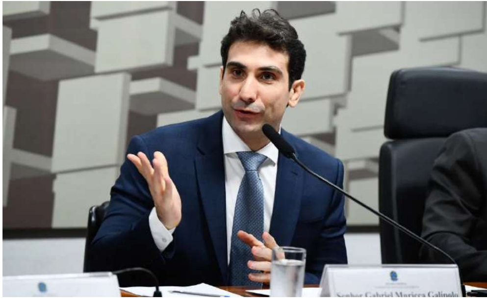
Gabriel Galípolo, presidente do BC, no Senado Federal

Renan afirmou que o Banco Central pode ter repetido, no caso envolvendo o BRB, problemas semelhantes aos identificados na condução do processo relacionado ao Banco Master.