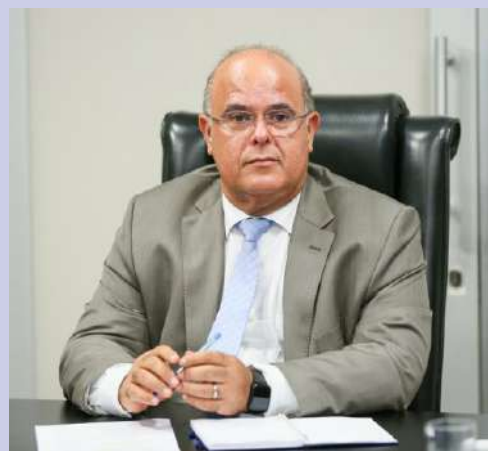
Desembargador Fernando Tourinho

“A transparência na administração pública não é favor, mas obrigação constitucional”, afirma trecho do documento assinado pela advogada em Maceió, no último dia 21 de maio.