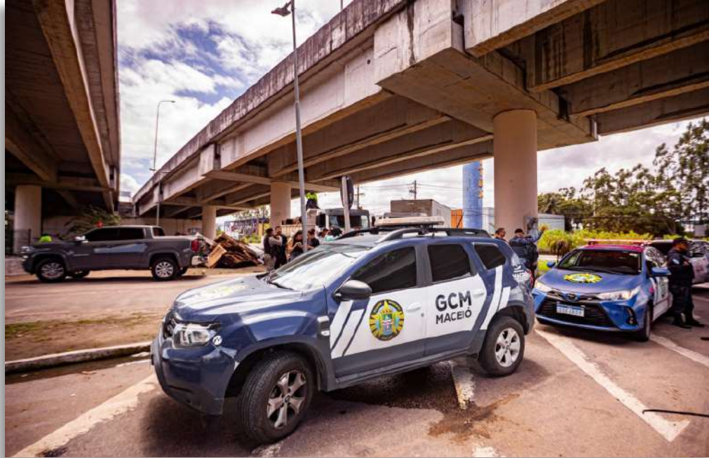
A população pode colaborar com o trabalho das autoridades denunciando atividades suspeitas por meio do telefone 153.

Outro local que recebeu reforço das equipes foi a Nova Orla, recentemente entregue pela Prefeitura de Maceió. Durante a ação, foram encontrados objetos provenientes de furto e armas brancas. Um homem foi conduzido à Central de Flagrantes para os procedimentos cabíveis.