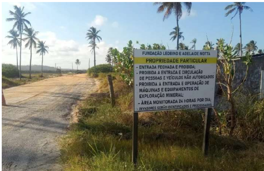
Terreno pertencente à Fundação Leobino e Adelaide Motta, na praia do Francês, em Marechal Deodoro (AL)

valoriza a transparência e o compromisso com a sociedade. Permanecemos à disposição para fornecer todas as informações necessárias para uma compreensão mais profunda sobre as iniciativas da Fundação em manter a higidez e regularidade de suas atuações. Estamos