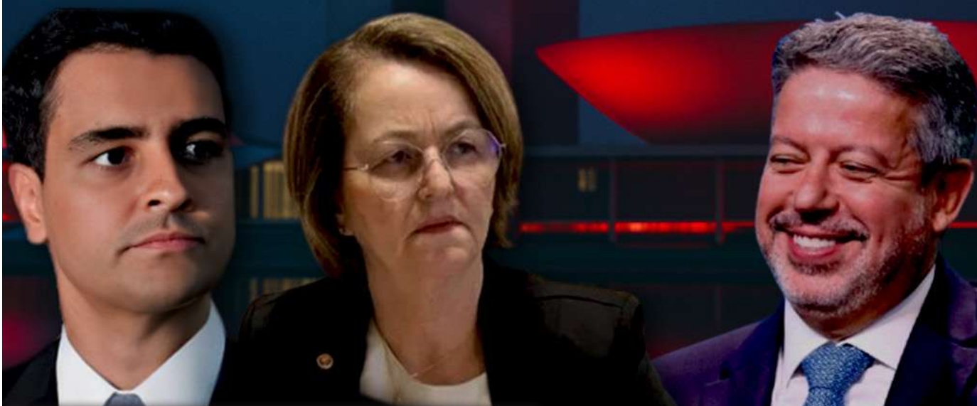
Deputado quer adiar escolha de Lula para corte superior enquanto negocia espaço na disputa pelo Senado